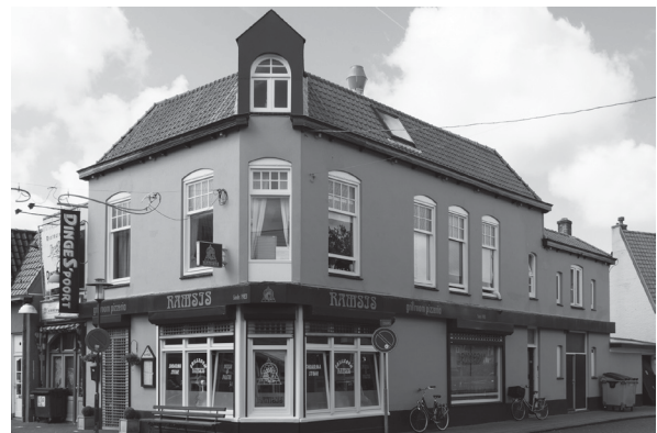
Huidige pand met Grillroom/Pizzeria Ramsis.