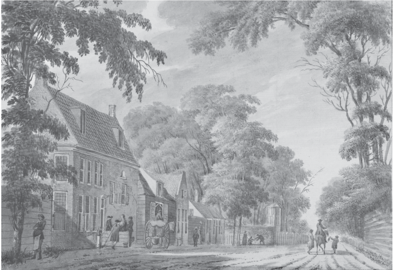
De Groene Valk, aquarel, 1775, door Hendrik Tavenier

bedrijvigheid op Hoofdstraat 186 in het dorp Santpoort