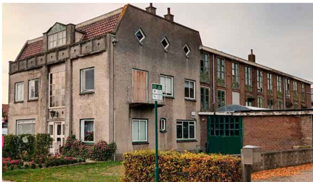
Weeresteinstraat 171 anno 2022