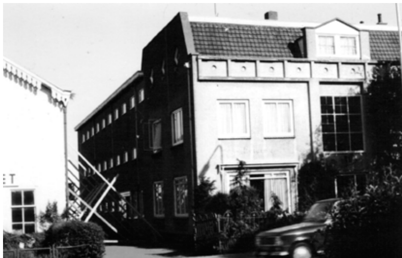
Woonhuis en bollenshuur Reforma, 1973