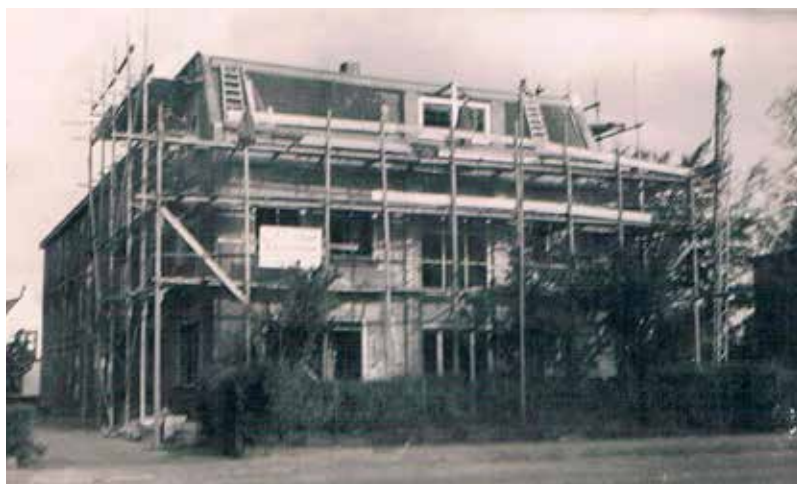
In 1956 werd het kantoor van de bollenshuur tot woning verbouwd

Uit respect voor zijn gelijknamige vader noemde de zoon zichzelf en zijn bureau ook Leendert Tol junior. Hij zou in Lisse en de Bollenstreek vele woningen en bedrijfsgebouwen op zijn naam stellen. Plus de verbouwing van Kees Verdegaa's aanwinst. Leendert Tol junior nam bepaald geen halve maatregelen. Het voorhuis, met de karakteristieke voorgevel uit 1912, werd drastisch gemoderniseerd in een strakke semiklassieke wederopbouwstijl, geheel grijs gespritzt, zodat er geen molecuul van het oude ontwerp overbleef. Ook een groot deel van de bollenshuur werd gestukt, waarbij de hoge ventilatieramen hun oude karakter verloren. De gymnasium gevormde Verdegaa gaf zijn nieuwe villa de trotse naam Reforma .