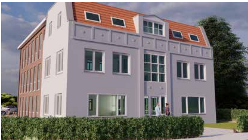
Ruigroks ontwerp voor het appartemen-tengebouw (Impressie TPS)

Tragisch jong overleed hij in 1990 op 41-jarige leeftijd. Kees bleef nog lang, tot in de jaren '90, doorgaan met de kwekerij, al werd het wel steeds minder. Pas na de eeuw- en millenniumwisseling verkasten Kees en Nel naar het woonzorgcentrum Bloemswaard. Kees overleed in 2006, Nel Verdegaal-Enthoven overleefde hem tot 2008.