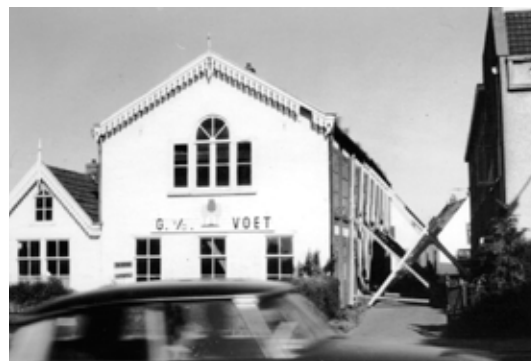
De gestutte bollenshuur naast Reforma van Gerrit van der Voet