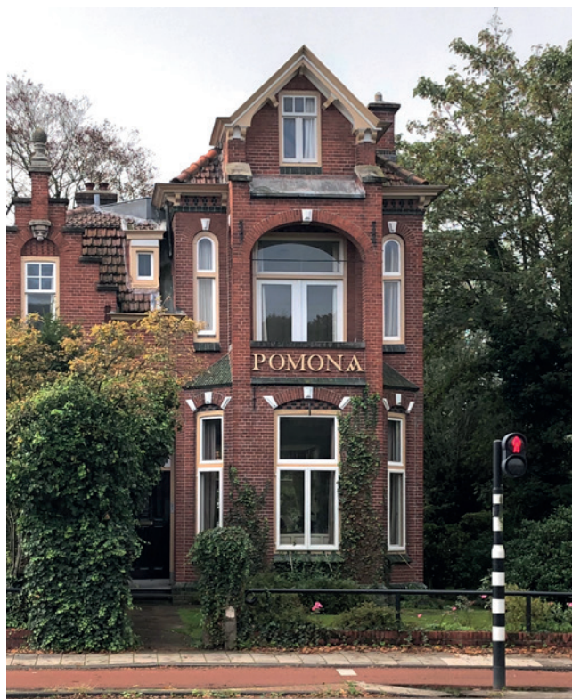
Villa Pomona op de Rijnsburgerweg, thans Leiden.