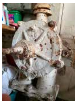
Enkele details van het interieur